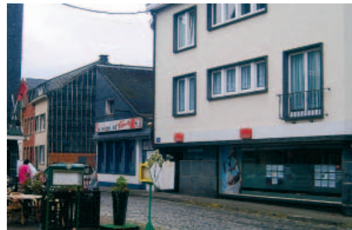
Le bâtiment actuel en voie de revitalisation.

Les travaux d'impétrants ont démarré lundi pour la revitalisation du quartier Cavens-place de Rome. Un chantier attendu (ou redouté...) depuis des mois et pour lequel la Ville a reçu 1,2 million € de la Région. La rue Cavens sera mise à sens unique, les trottoirs seront élargis, il y aura plus d'espace sur la place, moins de parkings et certains arbres seront abattus pour mettre le kiosque en valeur.