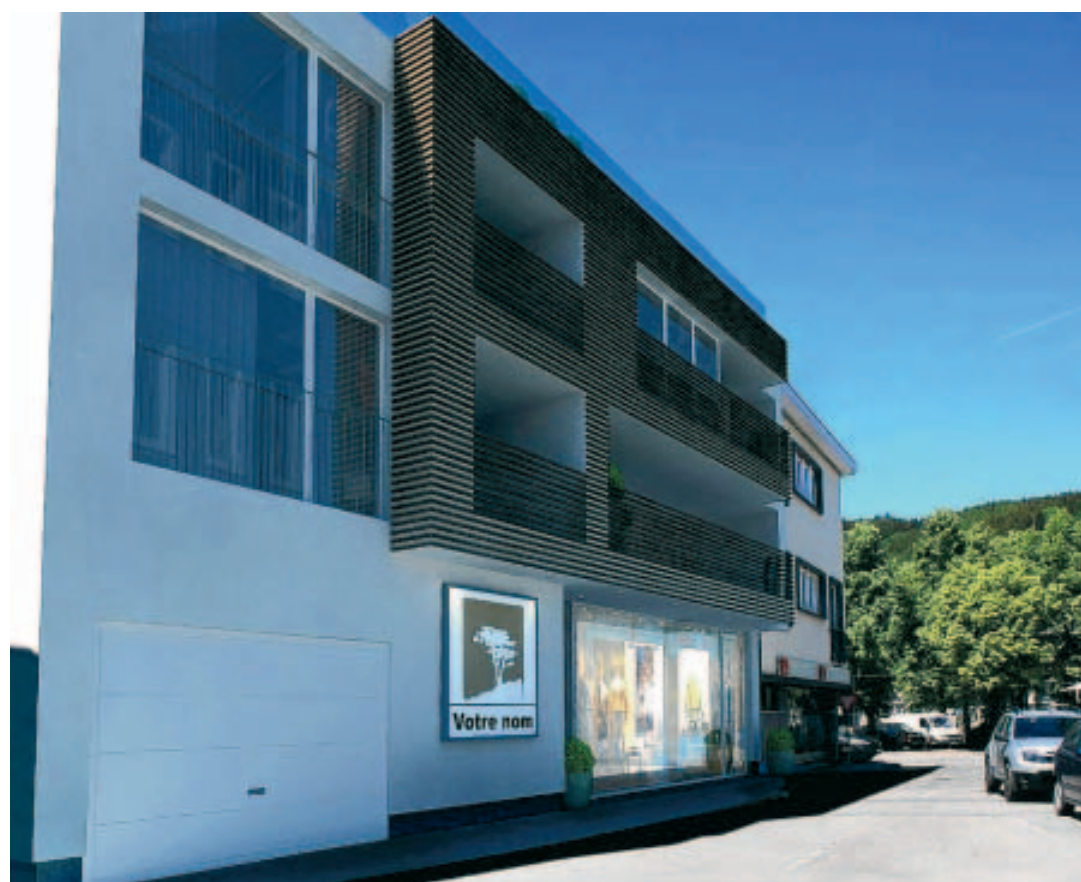
Une vue 3D de ce projet immobilier dans la ruelle Catherine André.